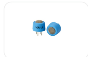
MR-热线型气体传感器