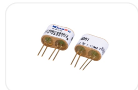
MD-热传导式气体传感器