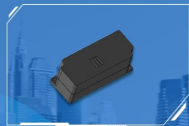
车载CO 2 模块

现阶段城市交通拥堵，空气污染严重。汽车空调开启外循环会造成车内充满尾气，导致车内空气污浊。但如果长期开启内循环，车内空气质量也会下降，造成人体不适。为了提高车内空气质量，保证驾乘舒适性，就需要合根据不同的行车环境和驾驶需求合理切换车内空气外循环和内循环。AQS传感器可以进行车外空气检测，配合空调系统在不同环境中合理切换空气循环方式，极大提高驾乘体验。