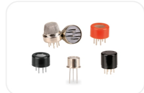
MQ-半导体气体传感器