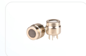
MG-固体电解质气体传感器