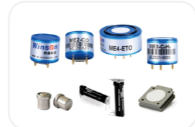
ME-电化学气体传感器