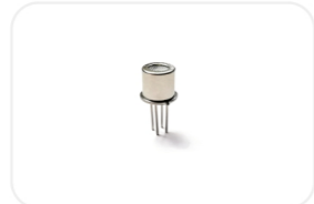
MP-平面半导体气体传感器